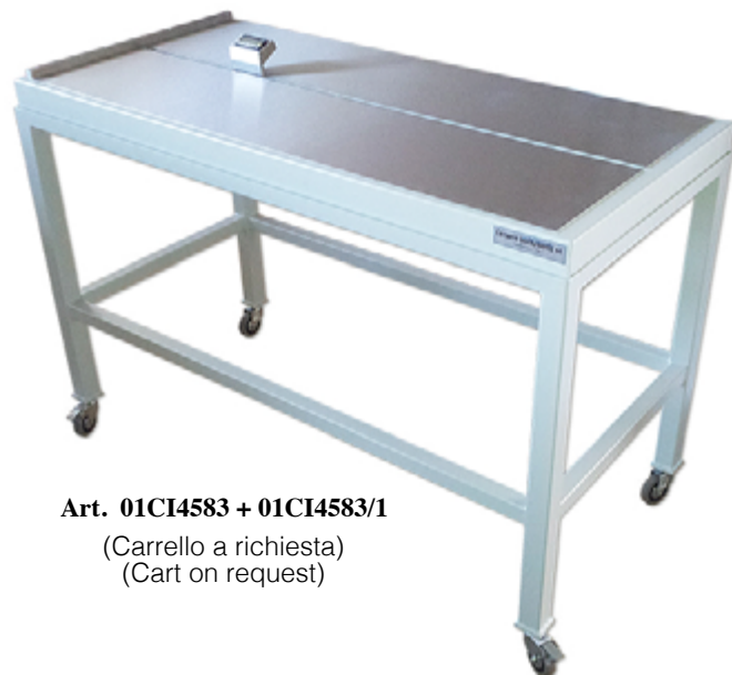
Art. 01CI4583 + 01CI4583/1 (Carrello a richiesta) (Cart on request)