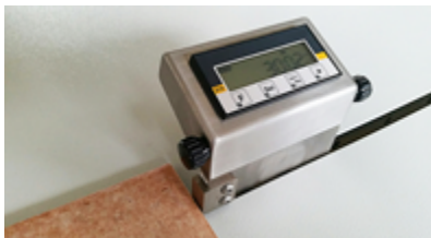
Cursore - Cursor